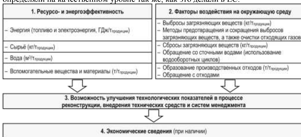
Р и с . 2. Последовательность этапов сравнительного анализа технологий при определении НДТ

Российские критерии сравнительного анализа решений, которые могут быть определены как НДТ, близки к международным, однако установлены в соответствии с особенностями отечественной юридической терминологии [2, 6]. В 2015–2017 гг. для определения НДТ и подготовки отечественных справочников по НДТ были организованы процедуры бенчмаркинга, в которых приняли участие отраслевые ассоциации и предприятия. Примерный алгоритм определения НДТ приведён на рис. 2. Сведения о потреблении ресурсов и о факторах воздействия на окружающую среду руководители предприятий предоставляли на условиях использования для анализа показателей и определения НДТ исключительно обезличенной информации. Экономические сведения были ограничены обсуждением платежей за негативное воздействие и затрат на природоохранные мероприятия. Информацию об инвестициях, необходимых для внедрения технологического процесса или установки средозащитного оборудования, участники бенчмаркинга не сообщали. Таким образом, при определении НДТ в России экономическую целесообразность применения тех или иных решений определяли на качественном уровне так же, как это делали в ЕС.